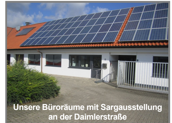
Unsere Büroräume mit Sargausstellung an der Daimlerstraße

Wir stehen Ihnen mit kompetenter Hilfe zur Seite. Wir begleiten Sie in der Zeit des Abschieds. Wir nehmen uns Zeit für Sie.